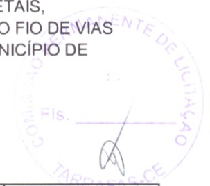
TABELA SEINFRA 28.1 – DESONERADA - B.D.I. = 25,01 %

ENDEREÇO: Zona Urbana da Sede e Zona Rural do Município de Tarrafas-CE.