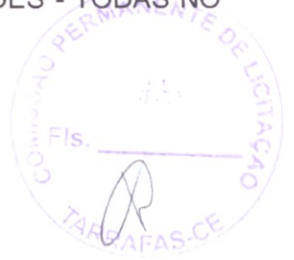
TABELA SEINFRA 28.1 – DESONERADA - B.D.I. = 25,01 %

ENDEREÇO: Zona Urbana da Sede e Zona Rural do Município de Tarrafas-CE.