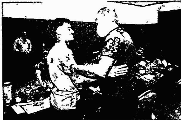
O primeiro atleta que fez a sua apresentação foi o atacante Philippe Coutinho que joga pelo Barcelona

Na época da convocação, o coordenador da seleção Juninho Paulista informou que